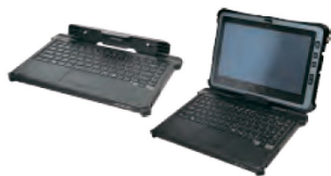
Съемная клавиатура с подсветкой