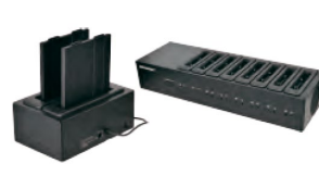
Зарядное устройство на 2 или 8 батарей