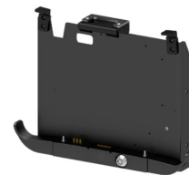
Док-станция для транспорта