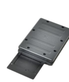
Модуль RFID LF/HF