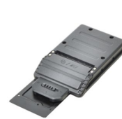
Модуль PCMCII Type II