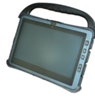
Жесткая ручка для переноски