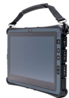
Мягкая ручка для переноски