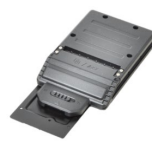
Модуль Express Card 54