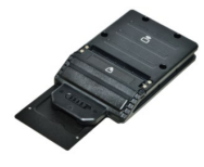
Модуль Smart Card + RFID