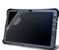
Защитная пленка для экрана