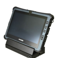
Док-станция для офиса